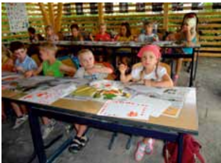
LGS basteln mit Naturmaterialien

Am Montag, den 20. August ging es gleich bei tollem Wetter nach Löbau auf die Landesgartenschau. Im „grünen Klassenzimmer“ konnten die Kinder mit Naturmaterialien basteln, auf dem großen Spielplatz wurde danach gehüpft und geklettert, bis die Puste ausging. Nach einem Picknick machten sie noch mit der Landesgartenbahn eine Rundfahrt über das große Gelände. Das war für alle ein ereignisreicher Tag.