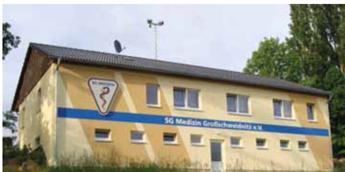
Hinteransicht vom Vereinshaus - hier soll die Auffahrt entstehen.

Jetzt möchten wir den nächsten Schritt zur Vervollkommnung unserer Anlage gehen und eine zwingend notwendige Auffahrt zum Stadion bzw. Verbandshaus bauen.