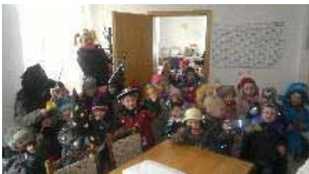
Die diesjährige Jahreshauptversammlung

Zum Fasching gab es im Gemeindeamt ein närrisches Treiben. Der Bürgermeister und seine Sekretärin wurden von vielen kleinen und großen Faschingsnarren überfallen. Wir haben uns sehr darüber gefreut. Es war herrlich anzusehen, wie die kleinen verkleideten Narren viel Spaß am Fasching hatten. Alle Kostüme waren mit viel Liebe gestaltet. Vielen Dank an die Mitarbeiterinnen unseres Kindergartens, dass Sie den Weg zu uns gefunden haben. Wir versprechen, auch nächstes Jahr vorbereitet zu sein!