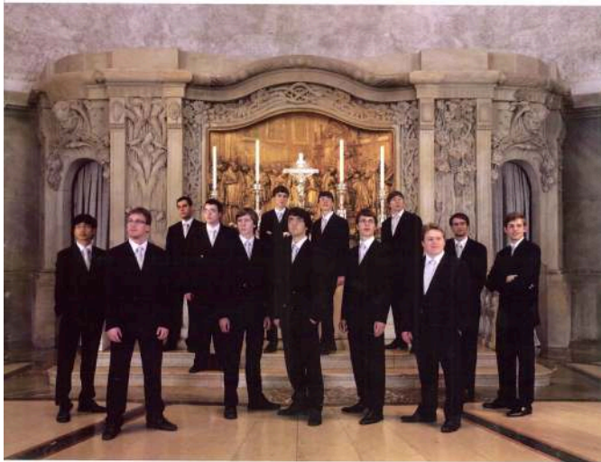
Die Abiturienten des Dresdner Kreuzchores 2010

Mit Stücken von Johann Sebastian Bach, Ludwig van Beethoven, Franz Schubert, Carl Maria von Weber, Felix Mendelssohn Bartholdy sowie ehemaligen Kreuzkantoren wie Julius Otto und Rudolf Mauersberger