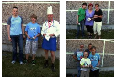
Die Gewinner auf der Kegelbahn zum Dorffest

Sollte jemand Lust zum Kegeln bekommen haben und unsere Nachwuchsmannschaft unterstützen wollen, Dienstag ab 17 Uhr kann's mit dem Training losgehen.