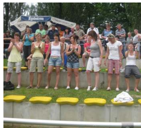
Fanblock in Görlitz