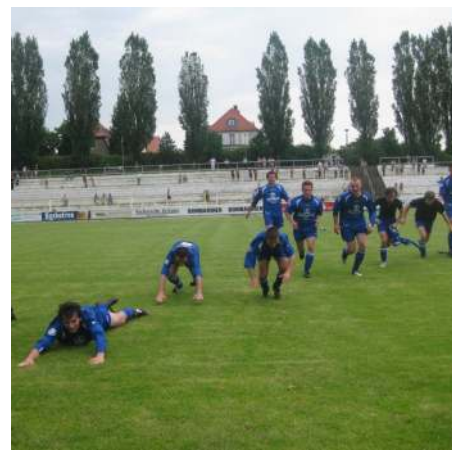
Jubel in Görlitz

dritten war eine kleine Sensation. Der zweite Sieg (3:2) gegen den damaligen Tabellenletzten aus Ostritz war zwar erwartet worden, musste aber schwer erkämpft werden. Im letzten Saisonspiel fuhren wir gemeinsam mit unseren zahlreichen Fans im Bus nach Görlitz. Der 3:1-Sieg gegen den Tabellennachbarn, die Landesliga-Reserve des NSV Gelb-Weiß Görlitz, war zumindest eine kleine Überraschung.