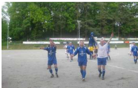
Jubelnde Spieler in Oderwitz

Es war so absolut nicht vorauszusehen, denn wir gewannen alle drei Spiele, haben am Ende tolle 47 Punkte und belegen einen nie erwarteten 9. Platz in der Abschlusstabelle. Der erste Sieg (2:1) auf dem Oderwitzer Hartplatz gegen den Tabellen-